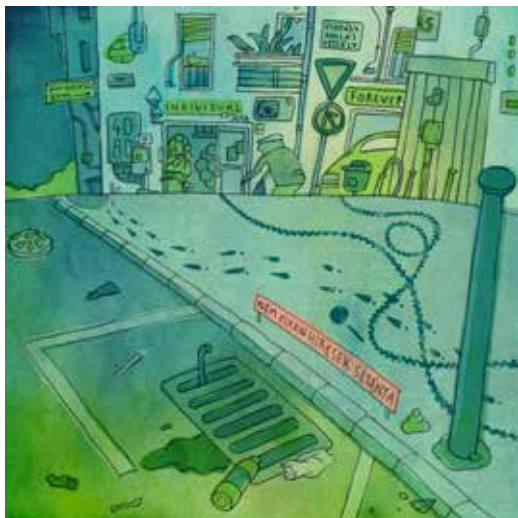
Illusztráció Dániel András