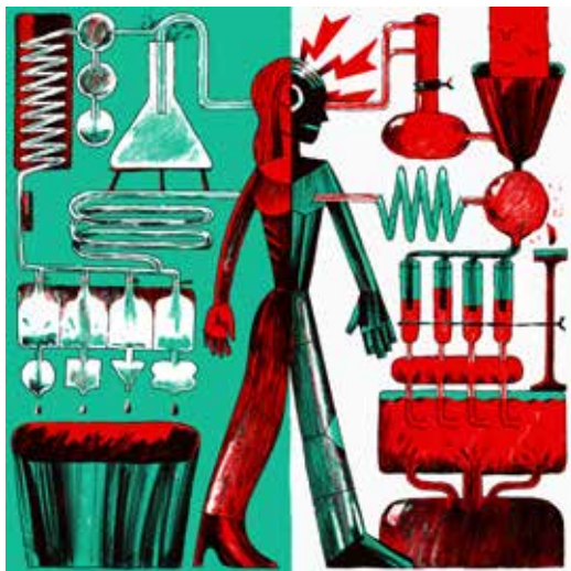
Illusztráció Zsuffa Zsanna