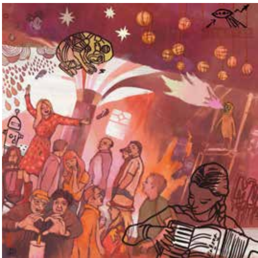
Illusztráció Paulovkin Boglárka