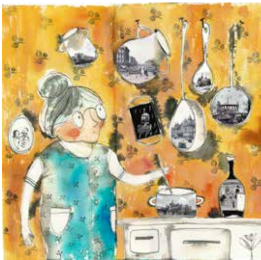
Illusztráció Simonyi Cecília