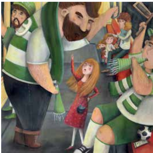
Illusztráció Pernyész Dóra