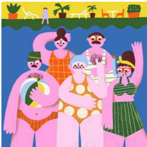
Illusztráció Zengővári Judit