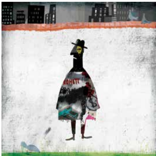
Illusztráció Schall Eszter